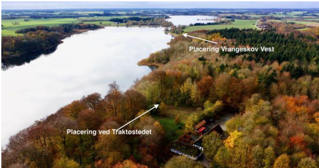
Her ses de to mulige placeringer, der undersøges for placering af Aktivitets- og Naturhuset i Vrangeskov

Vi er i tvivl om Miljøstyrelsen kan godkende placeringen ved Traktørstedet, hvorfor vi har fundet det nødvendigt også at arbejde med den alternative placering ved Vrangeskov Vest, som vi kalder den. Det er lige udenfor Vrangeskov ved dyreristen og lågen til folden - på kommunens areal og ikke i fredskov, som ved "Traktørstedet."