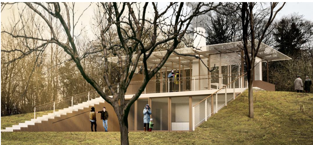
Se vedhæftede dokument, der viser hele skitseoplægget fra Spektrum Arkitekter

Begge placeringer passer til de skitser som Spektrum Arkitekterne er kommet frem til og begge placeringer ligger til grund for vores ansøgning, som er rettidigt fremsendt den 1. december.